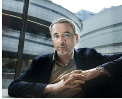
Resim 1. ( http://barismustecaplioglu.com/tr/index.htm , 28.11.2019).