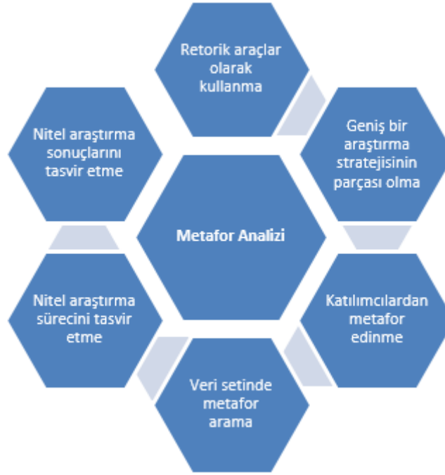
Şekil 3: Metafor analizinin kullanım alanları (Schmitt, 2005)

(Schmitt, 2005) aksiyonlarına sahiptir. Dil, çok yönlülüğü ve karmaşıklığıyla dikkat çeken en önemli varlıkların başında gelmektedir. Bir dili inceleyerek o dili konuşan topluma dair birçok konuda görüş sahibi olmak mümkündür. Bir anlatma, anlama ve anlaşma aracı olarak dil, örgüt ve yönetim çalışmalarındaki önemini her geçen gün arttırmaktadır. Çeşitli düşüncelere göre dil, örgütleri anlamada önemli bir araç olabileceği gibi örgütsel gerçekliklerin oluşumunda aktör olma rolü de üstenebilmektedir.